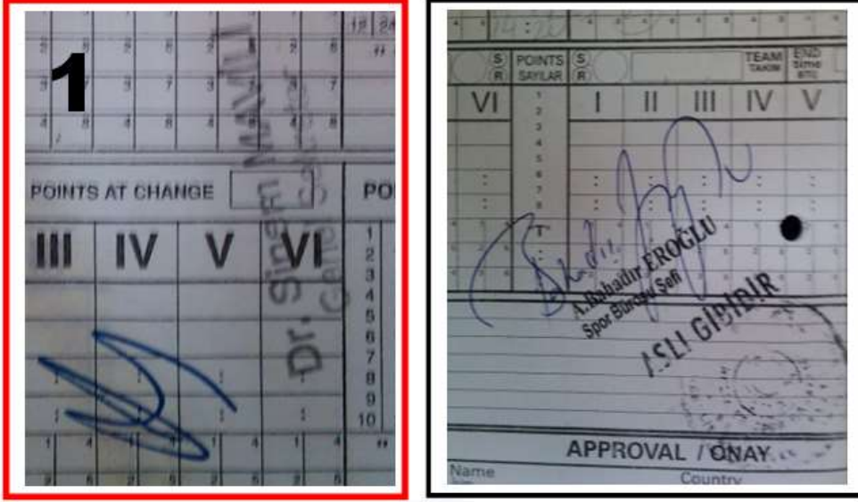
Şekil 3: Maç kağıdı üzerinde bulunması gereken resmi onay için iki farklı örnek